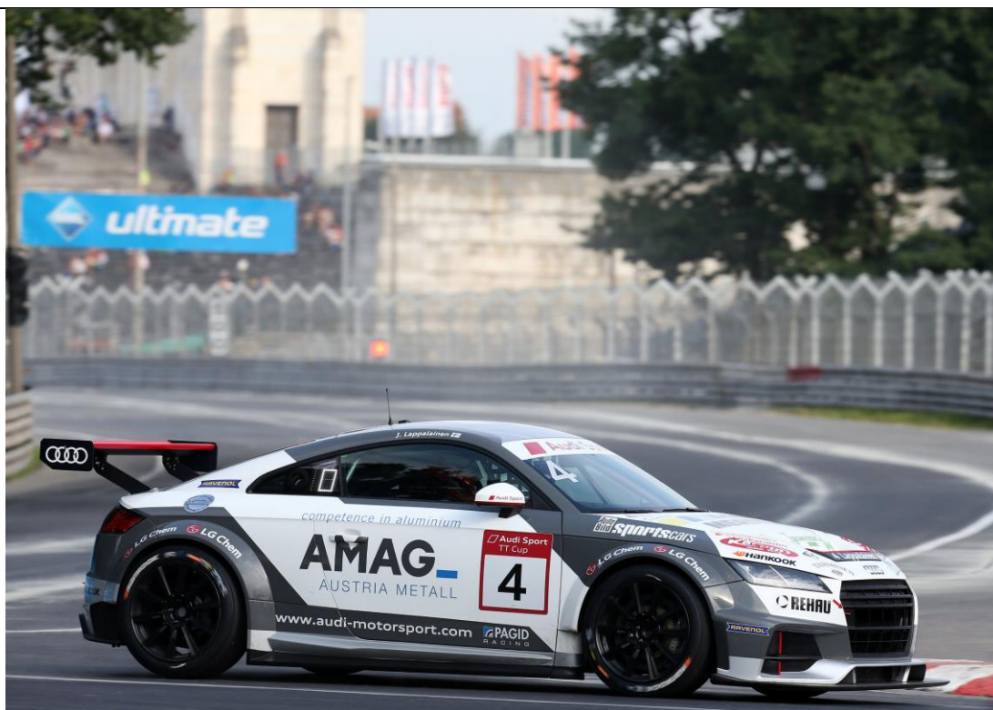
Norising3: Joonas Lappalainen.