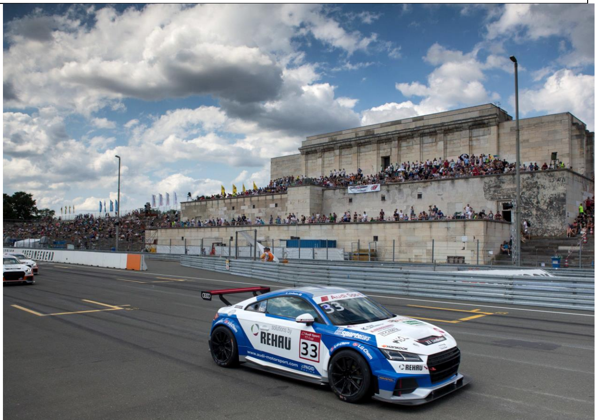
Norisring5: Emil Lindholm rollt in seine Startposition.