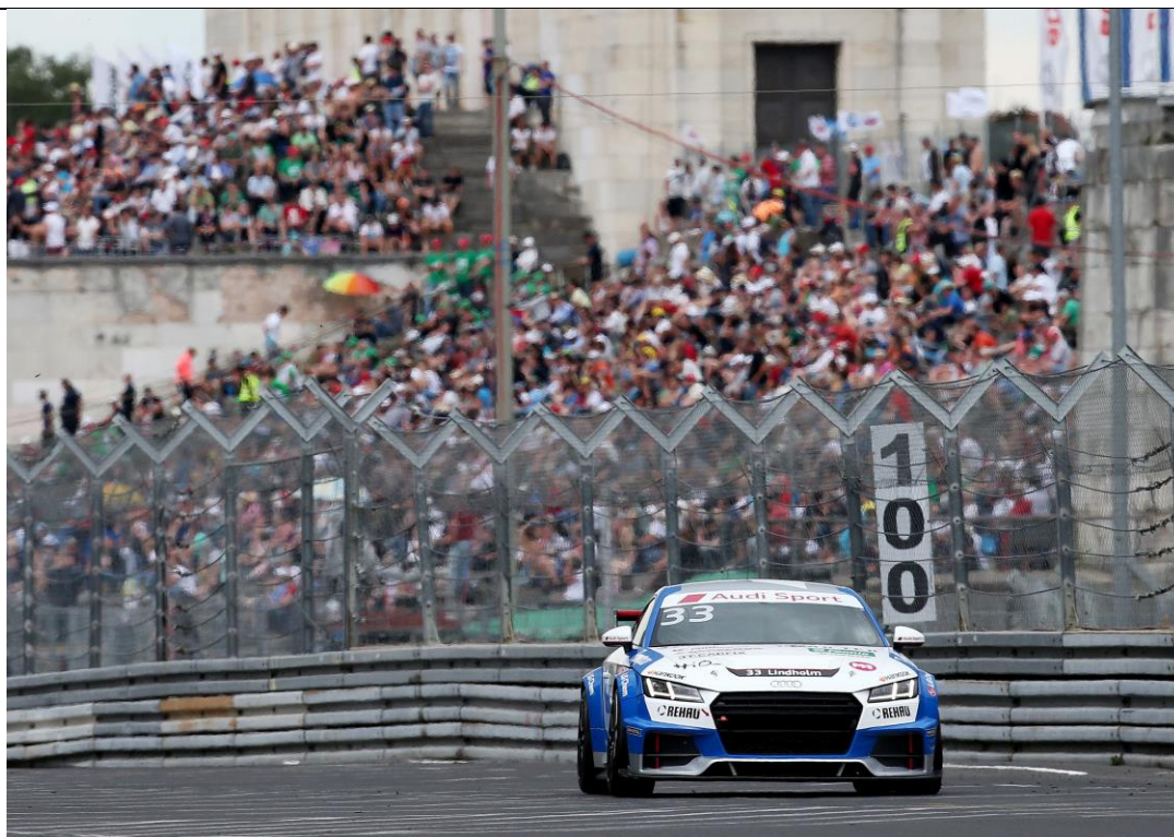
Norisring7: Emil Lindholm in den Straßenschluchten von Nürnberg.