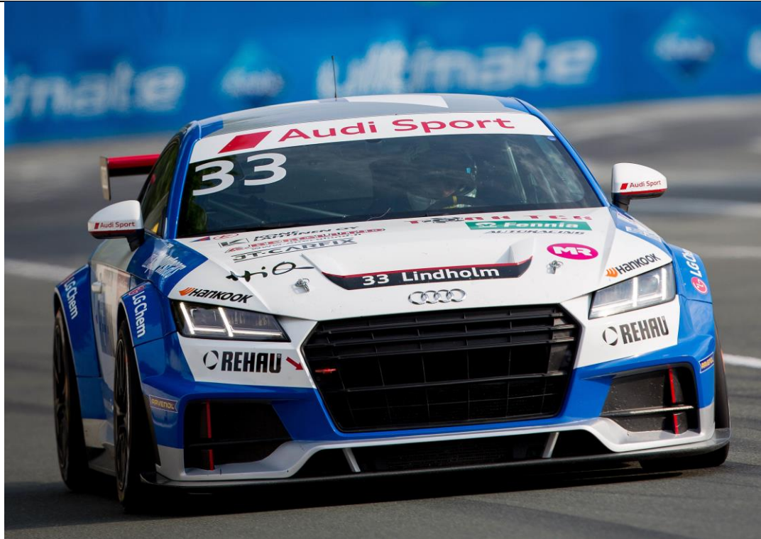
Norisring4: Emil Lindholm.