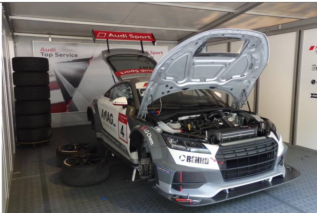
Vorbereitung2: Letzte Vorbereitungen für das Rennen an Joonas Lappalainen's Rennwagen.