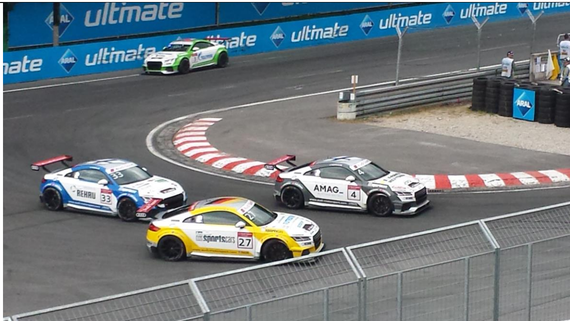
Entscheidung3: Joonas (#4) ist an Dennis Marschall (#27) vorbeigezogen. Emil (#33) hat für das Beschleunigungsduell gegen Dennis die bessere Ausgangsposition.