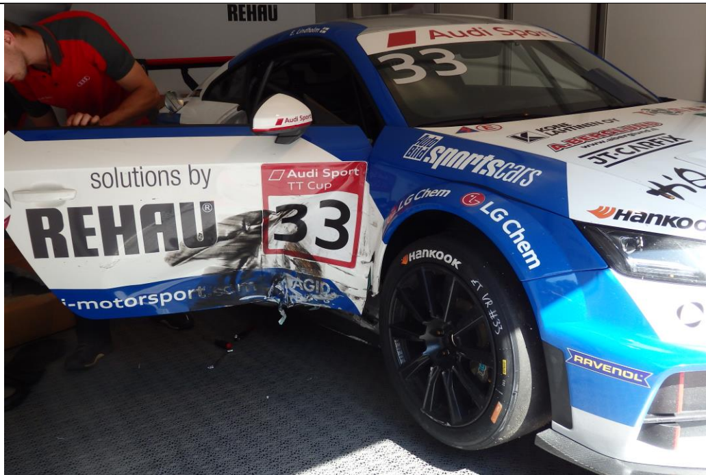
Vorbereitung1: Nach einer Rangelei im Qualifying muss an Emil Lindholms Auto die Tür ausgetauscht werden.