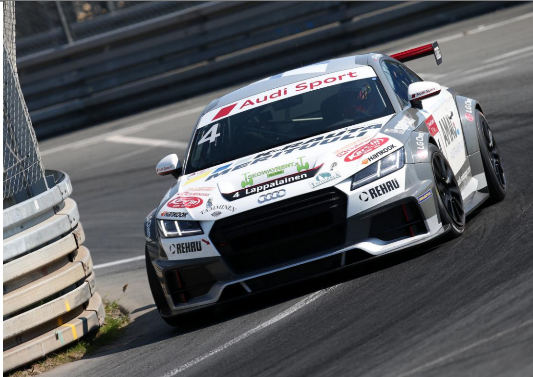
Norising2: Joonas Lappalainen nutzt in den engen Kurven jeden Zentimeter.