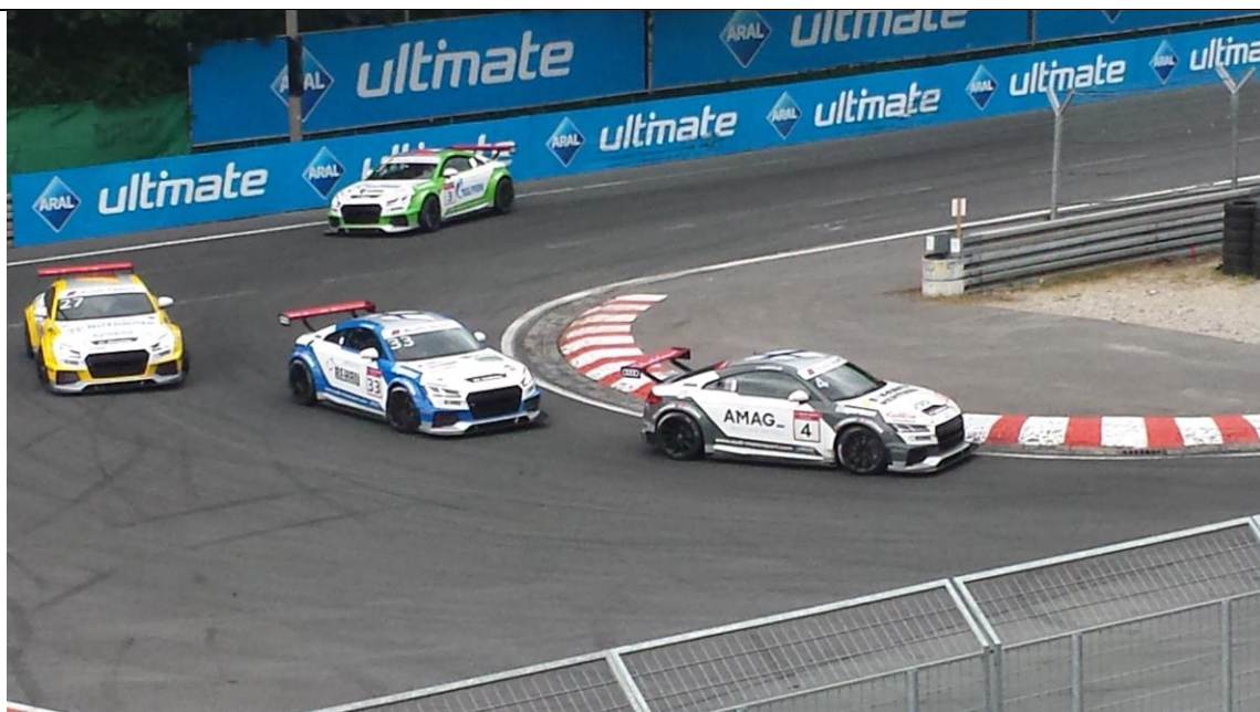
Entscheidung4: Joonas (#4) und Emil(#33) geben die Führung nicht mehr aus den Händen.