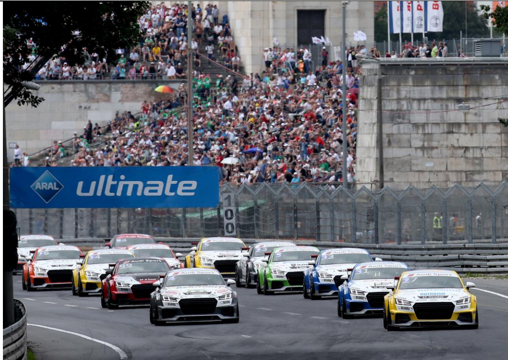
Norsiring6: Kurz nach dem Start – ganz vorne dabei. #4 Lappalainen, #33 Lindholm.