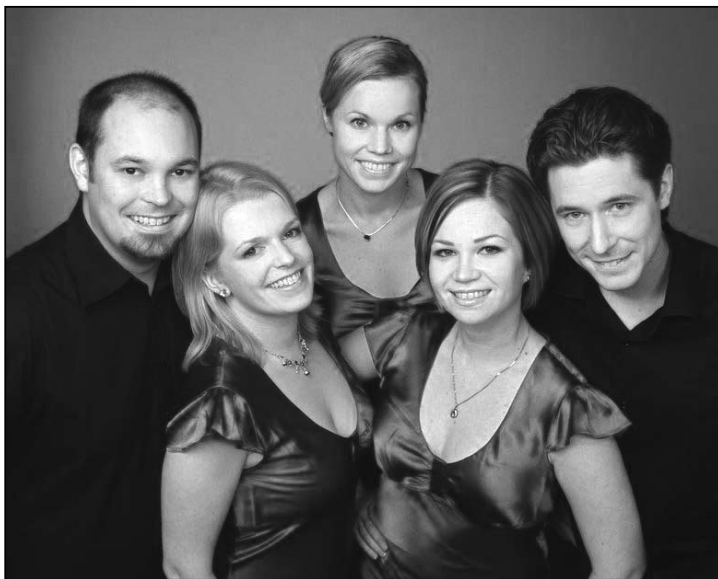
Bläserquintett Fantasia aus Finnland

Das fantastische Bläserquintett aus Finnland ist mit Unterstützung der DFG in Deutschland auf Tournee und kommt auch nach Wiesbaden.