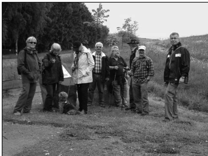
Vappu-Wanderung im Vulkanpark Eifel

Unser diesjähriger Vappu- Ausflug führte uns wieder mal in die Vulkaneifel. Ziel war das Booser Dop- pelmaar in der Nähe der Stadt Mayen. Der Rund- wanderweg gehört zu den neu geschaffenen „Traumpfaden“ im Rhein- Mosel-Eifel-Land. Von einem Aussichtsturm hat- ten wir Sicht bis zur Nür- burg und in den Wester- wald. Unterhalb des Tur- mes offenbarte sich uns die Zeitgeschichte der Erde in Form einer Lavabombe. Hier kann man unsere Erde in ihrer Zeitge-