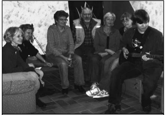
Bereitete viel Freude: der junge finnische Musikus