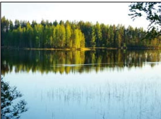
Ulla und Bernd Schmeling

ses Einfangen unserer Umgebung ist in allen Bildern spürbar. So kommt der „Fotokunst“ eben auch eine wichtige emotionale Dimension zu. Schön!