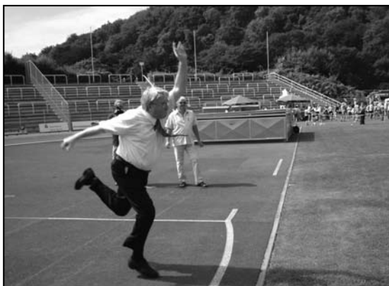
Akrobatische Übungen beim Gummistiefel-Werfen

Ganz neu ist diese skurrile Sportart nicht für Gera, denn schon zur Bundesgartenschau (BUGA) 2007 wurden hier die ersten Wettkämpfe durchgeführt und fanden ein interessiertes Publikum.