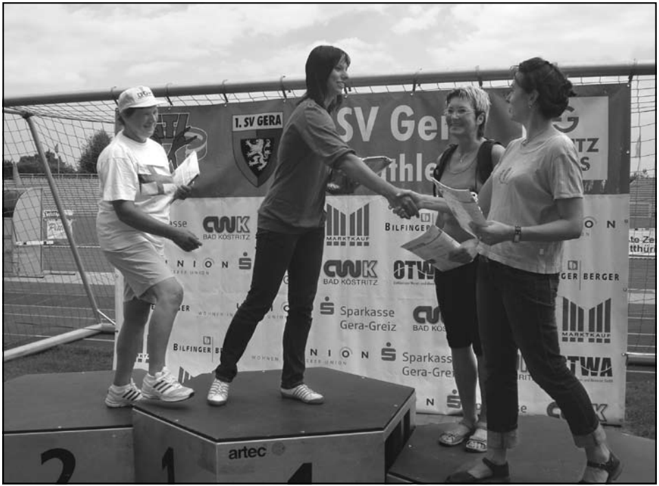
Siegerehrung bei den Damen in Gera

kam auch die Frage auf, ob denn die DFG zukünftig auch einen Handy-Weitwurf-Wettbewerb organisieren würde. Warum eigentlich nicht? Derartige Veranstaltungen geben immer wieder die Möglichkeit,