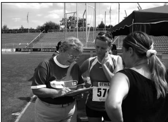
Die Ergebnisse wurden akribisch dokumentiert.

Man schmunzelt... und macht mit! Diesmal waren es fast ein halbes Hundert Leute, die ihre Geschicklichkeit erproben wollten und schließlich ihren Besten bei den Herren mit einem Wurf von 30 Metern, bei den Damen mit einem Wurf von 19,6 Metern ermittelten.