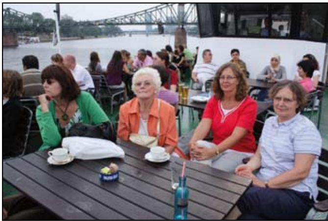
Ausflugsfahrt auf dem Main

Der mir von vielen als wunderschön dargestellte Herbst, die „Ruska-Zeit“, war allerdings sehr verregnet. Die ersten Polarlichter lassen auch noch auf sich warten. Ganz in der Nähe meines Studentenwohnheimes gibt es eine Aussichtsplattform, von der aus man einen wunderschönen Blick auf die Umgebung und natürlich auch den Himmel hat. Sobald die Vorhersage eine gute Chance für das Auftreten von Nordlichtern zeigt, werden wir dort unser Quartier beziehen, und ich hoffe, dass einige schöne Fotos entstehen werden.