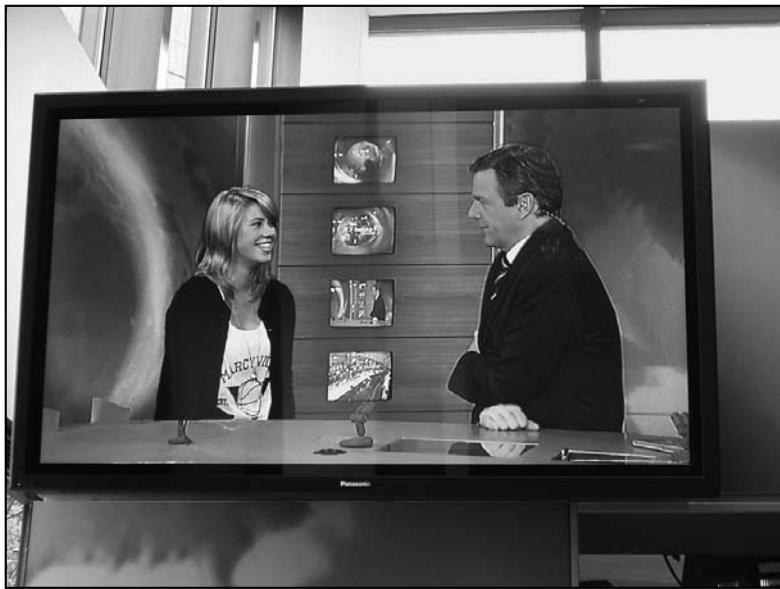
Echt - oder Trick? In der Bluebox mit Claus Kleber

Pfalz-Tag in Bad Kreuznach stattfindet. Fast alle haben dieses Fest „mitgenommen“ und sind entsprechend etwas später angereist oder fünf statt vier Wochen geblieben.