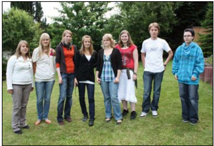
Austauschschüler und ihre Gastgeschwister an Juhannus

Unsere Weihnachtsfeier wird diesmal am Samstag, dem 05.12.2009, stattfinden. Wir treffen uns um 18 Uhr wieder im Blauen Fasan in Solms-Oberndorf bei finnischem Essen. Wer etwas zur Feier beitragen möchte