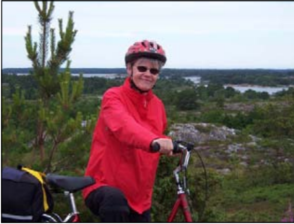
Radtour auf Åland: die Co-Autorin des Berichtes

Unbedingt zu empfehlen ist es, die Standardtour um einen Tag zu verlängern, so wie wir es gemacht haben. Man sieht