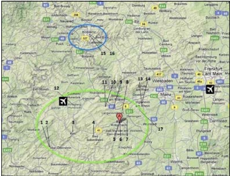
Verteilung der 17 Gastschüler im Jahr 2011