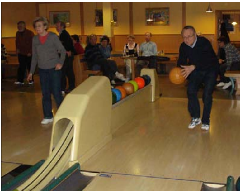
Spaß und Bewegung kamen beim Bowlen nicht zu kurz

dass der Literatur-Bär „Nalle“ seit der Bundesgartenschau in Gera und Ronneburg im Partnerschaftsgarten von Kuopio im Geraer Hofwiesenspark sitzt und Besucher erfreut. Dort zieht er in räumlicher Nähe zur Hurvinek und Spejbel, den bekannten tschechischen Figuren, die von der Partnerstadt Plzen aufgestellt wurden, die Aufmerksamkeit auf sich.