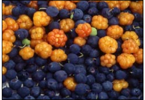
Beeren - Karl Nitschke