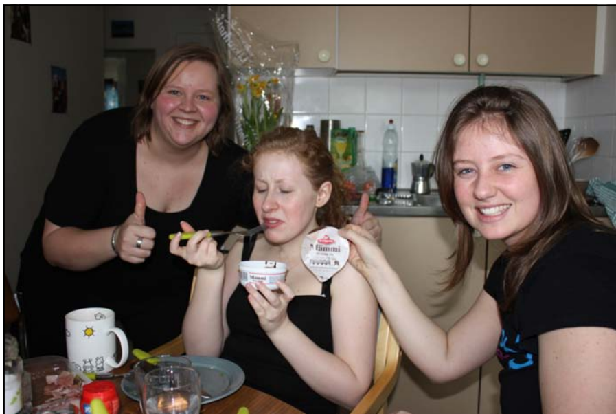
Ein Genuss, der in Erinnerung bleibt: Mämmi

mich, während sie sich bravourös geschlagen hat, mehrmals auf die Nase gelegt habe. Das kommt eben davon, wenn man zu übermütig wird. ☺ Für eine Woche hatten wir auch einen Mietwagen genommen, und das erste Ziel war natürlich der Ort, den alle Touristen gesehen haben müssen – Santa Claus