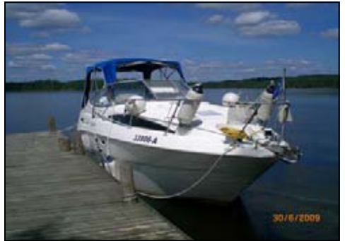
Mit eigenem Boot auf dem Saimaa - Dietmar Koster