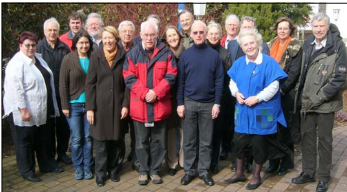
Für die DFG Hessen aktiv: Landesvorstand und Bezirksgruppenvorsitzende

Berichte aus den einzelnen Arbeitsbereichen, Mitgliederentwicklung, Schüleraustausch und viele weitere Themen standen auf der Tagesordnung.