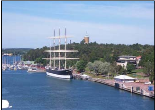
Die „Pommern“ in Mariehamn

Falls man die Radtour selbst plant, was etwas aufwändig, aber durchaus möglich ist, sollte man wissen, dass es offensichtlich eine gewisse Konkurrenz zwischen Viking Line und Eckerö-Linjen gibt. Dies führt dazu, dass der jeweilige Anbieter bevorzugt auf den Prospekten und auf der Webseite seine Vertragsunterkünfte darstellt. Also bei beiden gucken. So sind die Verzeichnisse nie ganz vollständig, und es fehlt manchmal auch der Hinweis auf zusätzliche Übernachtungs- oder Essmöglichkeiten auch an Stellen für Radwanderer/Wanderer ohne viel Gepäck, die na-