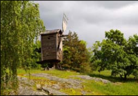
Windmühle bei Järvenpää - Bernd Schmeling