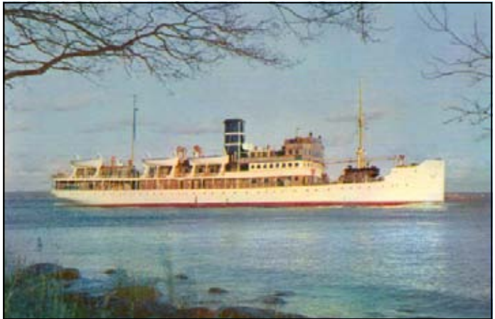
Erinnerung an ein stolzes Schiff: Wellamo