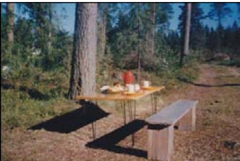
Frühstück im Wald - Terttu Wachtler