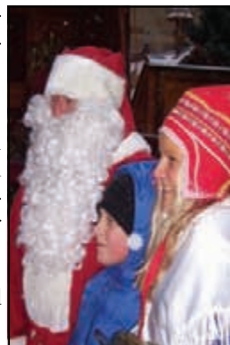
Joulupukki auf dem Weihnachtsmarkt

Stammtisch Montag, 04.04.2011, 19 Uhr Gaststätte KarlsHospital Weserstr. 2, Kassel