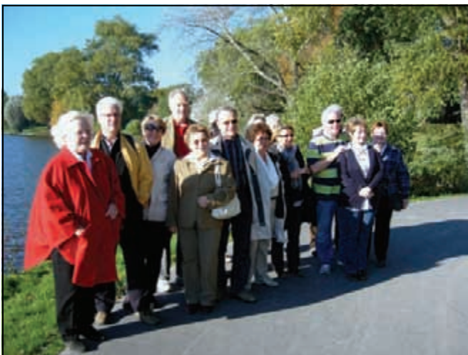
Eine eingeschworene, fröhliche Truppe in Münster

Es bleiben drei vergnüglich erlebnisreiche Tage in einer wunderschönen sympathischen Stadt. Könnte man noch mal studieren, Münster wäre die erste Wahl. Es sollte nicht beim ersten Rendezvous bleiben.