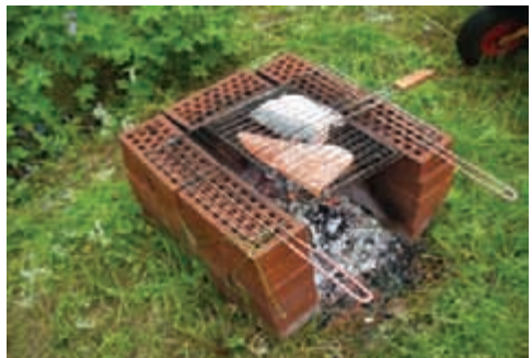
Einfach lecker - Yrjö Heiskanen