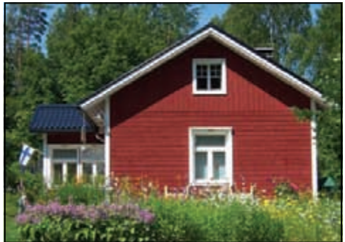
Finnische Idylle - Bernhard Strotmann