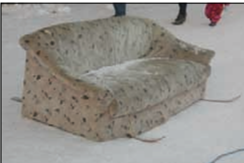
Sofa auf Skiern - Gundi Bernhardt