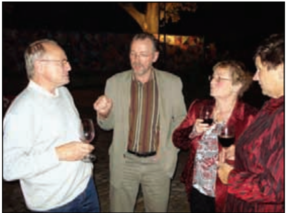
Gute, informative Gespräche in Aschersleben