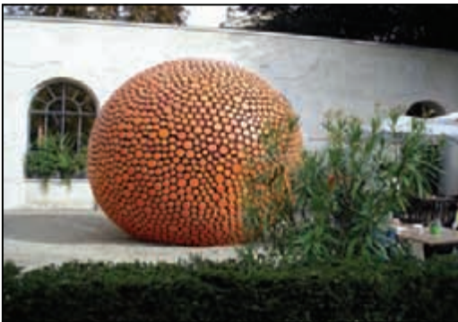
Spielball auf der Landesgartenschau

Und dann der Finnlandtag selbst. Eine neue Städtepartnerschaft wurde aus der Taufe gehoben, Handwerker und Künstler stellten sich vor, Frauen wurden getragen, finnischer Tango getanzt, Gummistiefel weit geworfen und als neue Disziplin „Handyzielwurf“ kreiert. Es war ein amüsanter Nachmittag für alle Besucher, wobei die DFG nicht müde wird zu betonen, dass der Spaß nur Mittel zum Zweck ist und nur einen Teil finnischer Lebensfreude widerspiegelt. So will die Deutsch-