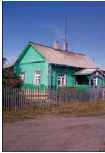
Haus in Vianan Kemi

man besser nicht so genau nachdenken sollte. Es bringt uns in drei Stunden zur Insel Solowetsky, der größten von sechs Inseln des gleichnamigen Archipels. Schon von weitem erkennt man die beeindruckenden Zwiebeltürme des orthodoxen